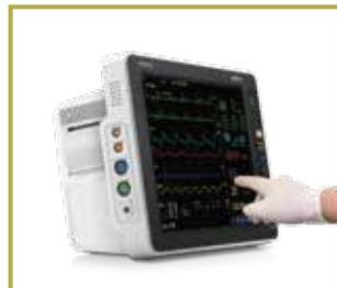
Interfaces fáciles de usar