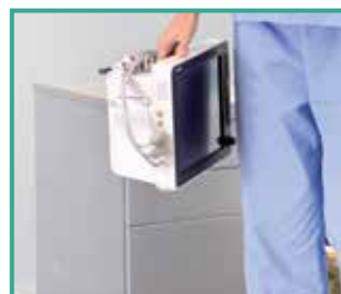
Protección contra caídas