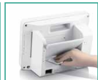
Compatible con múltiples agentes de limpieza