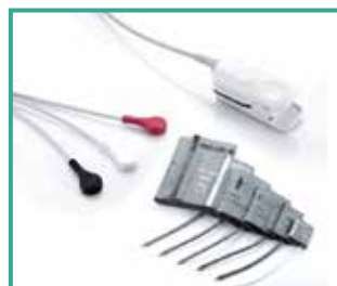
Accesorios de alta calidad