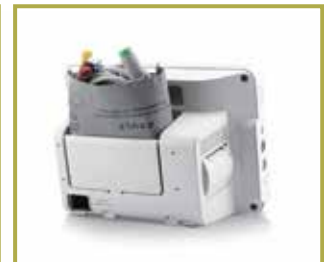
Gabinete exclusivo para accesorios